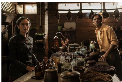
Gambar 2. Scene Dasiyah memasuki ruang saus