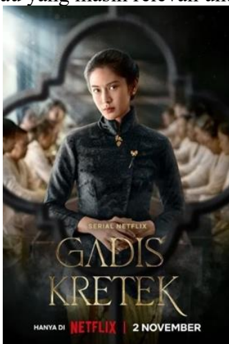
Gambar 1. Poster Film Gadis Kretek

Industri film Indonesia terus berkembang dari waktu ke waktu, apalagi dengan adanya kemajuan teknologi. Selain itu, ide-ide kreatif dari para pembuat film juga semakin banyak. Salah satu tren yang sekarang diminati adalah film series atau serial. Film series biasanya terdiri dari beberapa episode, sehingga alur cerita bisa lebih panjang, karakter lebih dikembangkan, dan konflik lebih kompleks. Format ini membuat penonton bisa terhubung lebih lama dengan cerita, sehingga daya tariknya semakin tinggi. Genrenya juga beragam, mulai dari drama, komedi, horor, sampai fiksi ilmiah. Tidak hanya sekadar menghibur, beberapa serial juga menyisipkan isu-isu sosial, seperti kesetaraan gender, kekerasan dalam rumah tangga, hingga budaya patriarki yang masih melekat dalam kehidupan sehari-hari. Salah satu contoh film seri yang menarik perhatian publik dan mengangkat isu budaya patriarki adalah serial berjudul “Gadis Kretek”, yang tidak hanya menghadirkan drama historis dan romantika, tetapi juga menyentuh aspek-aspek budaya dan struktur sosial di masa lampau yang masih relevan untuk dikaji pada masa kini.