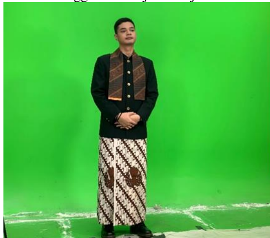
Gambar 2. Host menggunakan baju adat jawa