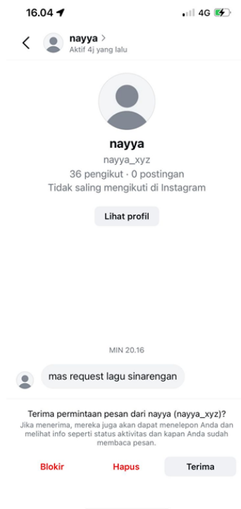
Gambar 5. Penonton me-request lagu yang ingin ditayangkan

Program Konco Ngaso juga menjadi salah satu tayangan teratas di Hanacaraka TV mencatat rating yang menarik perhatian penonton, keberhasilan ini tidak terlepas dari kemampuan program dalam menciptakan konten yang menghibur dan relevan. Sebagai top program Konco Ngaso bisa membuka lebih banyak peluang untuk meningkatkan visibilitas budaya jawa di kalangan masyarakat luas, menunjukkan bahwa program Konco Ngaso bukan hanya sekedar hiburan tapi sebuah gerakan untuk melestarikan dan memperkenalkan warisan budaya lebih luas lagi. Hal ini dinyatakan dalam wawancara yang dilakukan oleh informan utama menyatakan bahwa :