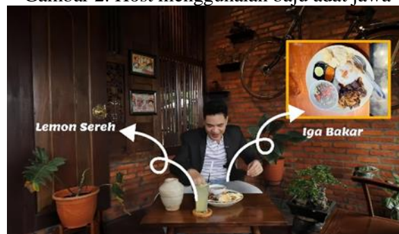
Gambar 3. Adegan host me-review makanan dan minuman khas

Dalam upaya menciptakan tayangan yang lebih menarik dan berkesan, tim Konco Ngaso berinovasi dengan mengembangkan gimmick host yang terhubung dengan cerita di balik lagu-lagu yang ditampilkan. Misalnya ketika sebuah lagu mengisahkan cinta, tim mengambil tema asmara sebagai latarbelakang untuk menciptakan narasi yang lebih mendalam. Dengan pendekatan ini, setiap host tidak hanya berfungsi sebagai penyampai informasi tetapi sebagai penghidup cerita. Host akan membagikan pengalaman atau kisah yang relevan dengan tema asmara yang di angkat dalam lagu yang disiarkan. Hal ini tidak hanya menarik perhatian penonton tetapi membangun kedekatan emosional dengan