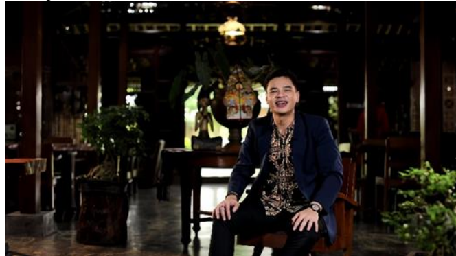
Gambar 1. Host menggunakan baju batik jawa di mix dengan jas

“Aku mendefinisikan nya melewati gimmick, nah gimmick itu yang aku manfaatin untuk mendefinisikan nilai lokal jawa, seperti menggunakan baju-baju lokal jawa, tetapi kita mix dengan jas, atau jaket supaya lebih terlihat santai. Dan juga ada adegan seperti makanan atau minuman jawa”