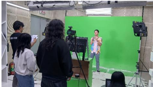
Gambar 7. Proses shooting Konco Ngaso

“Pada saat produksi kita sangat berusaha menjaga kenyamanan antar tim produksi dan hostnya, dan untuk pengambilan gambar itu juga harus sesuai biar kualitas visualnya menarik”