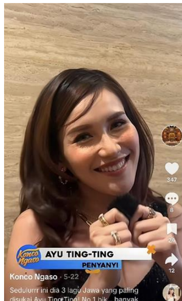
Gambar 9. Wawancara Ayu Ting-ting

“Konco Ngaso juga memberikan tayangan berupa wawancara dengan artis yang lagunya akan ditampilkan pada program ini , untuk mengetahui background dari artis tersebut”