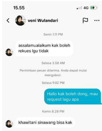
Gambar 4. Penonton me-request lagu yang ingin ditayangkan