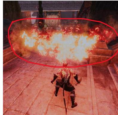
Gambar 11. Visual skill Dragonfire setelah Class Rework