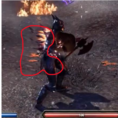
Gambar 14. Visual skill Earthspike Mantle sebelum Class Rework

Selain itu, fenomena ini juga menunjukkan bahwa peningkatan juiciness atau intensitas feedback visual tidak selalu menghasilkan respons positif secara penuh apabila perubahan tersebut mengurangi elemen visual ikonik yang telah melekat pada pengalaman pemain sebelumnya.