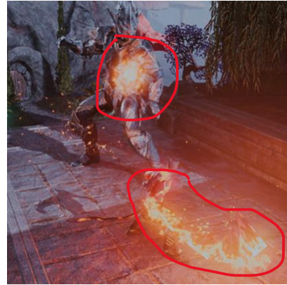
Gambar 9. Visual skill Molten Whip setelah Class Rework