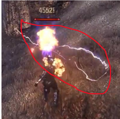
Gambar 8. Visual skill Molten Whip sebelum Class Rework