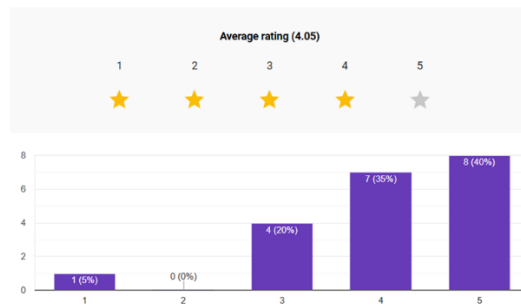
Gambar 2. Column chart pertanyaan “Visual membantu memahami combat”

4. Efek visual membantu saya memahami apa yang sedang terjadi di combat