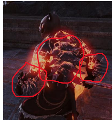
Gambar 15. Visual skill Earthspike Mantle setelah Class Rework

Temuan ini menunjukkan bahwa dalam desain visual MMORPG, peningkatan kualitas visual secara teknis belum tentu menghasilkan pengalaman emosional yang lebih kuat