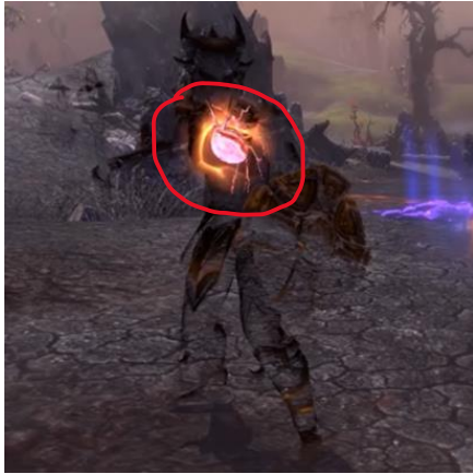
Gambar 12. Visual skill Dragon Blood sebelum Class Rework