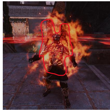
Gambar 13. Visual skill Dragon Blood setelah Class Rework

Fenomena tersebut menunjukkan bahwa desain visual skill dalam MMORPG bekerja dalam dua lapisan, yaitu lapisan fungsional dan lapisan identitas. Lapisan fungsional berkaitan dengan readability, kejelasan efek, dan feedback gameplay, sedangkan lapisan identitas berkaitan dengan simbol visual, familiarity, dan keterikatan emosional pemain terhadap suatu skill. Dragon Blood berhasil meningkat pada lapisan fungsional melalui efek