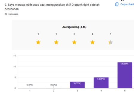
Gambar 7. Column chart pertanyaan “Lebih puas menggunakan skill”

Beberapa responden menyatakan Molten Whip sebagai salah satu skill dengan perubahan visual paling memuaskan. Efek cambuk api pada versi rework terlihat lebih besar dengan animasi yang lebih agresif dan efek glow yang lebih terang dibanding versi sebelumnya. Efek api kini mengikuti lintasan serangan karakter secara penuh sehingga memberikan sensasi pengaruh yang lebih kuat saat skill digunakan.