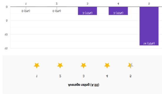
Gambar 1. Column chart pertanyaan “Skill lebih mudah dikenali saat combat”