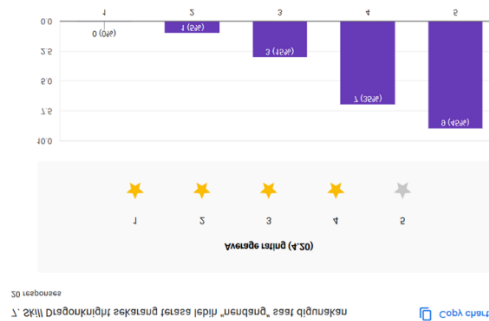
Gambar 5. Column chart pertanyaan “Skill terasa lebih berpengaruh”