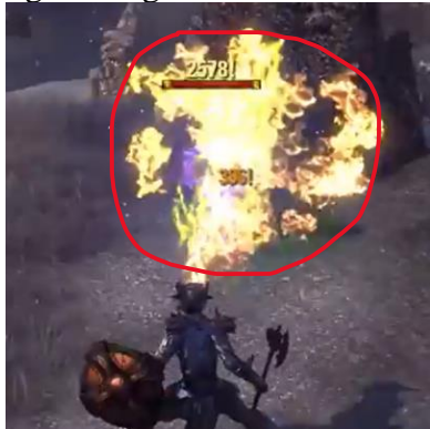
Gambar 10. Visual skill Dragonfire sebelum Class Rework

Responden juga mengatakan bahwa skill Dragonfire mengalami perubahan yang sangat memanjakan mata karena efek semburan api yang lebih besar dan agresif. Responden menyebutkan bahwa visual Dragonfire sekarang terasa seperti “napas naga” dibanding sekadar efek api biasa. Efek visual baru dianggap lebih sesuai dengan identitas Dragonknight sebagai class bertema naga dan api.