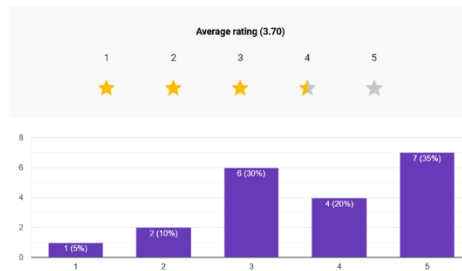
Gambar 4. Column chart pertanyaan “Combat tidak membingungkan”

5. Saya lebih cepat memahami timing skill dibanding sebelumnya