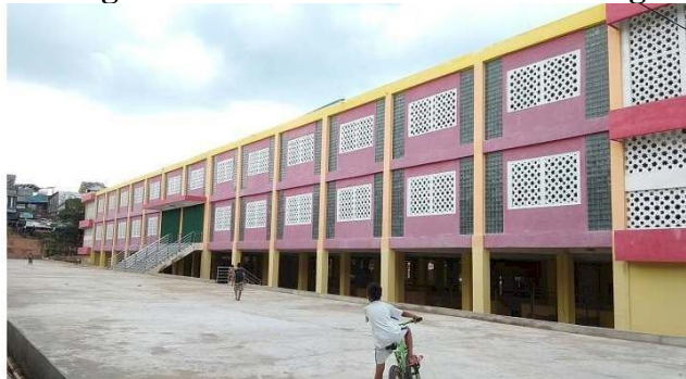
Gambar 2 Gedung Pasar Tradisional Kecamatan Singkut

Adapun sarana perdagangan menurut jenis sarana perdagangan yang ada di Kecamatan Singkut paling banyak adalah Mini Market/Swalayan/Supermarket dengan jumlah sebanyak 8 unit. Selanjutnya, Kelompok Pertokoan menempati urutan kedua dengan jumlah 6 unit. Sementara itu, sarana perdagangan berupa Pasar hanya berjumlah 1 unit, demikian pula dengan Restoran/Rumah Makan yang juga tercatat sebanyak 1 unit. (BPS Sarolangun, Kecamatan Singkut Dalam Angka 2024). Data ini menunjukkan bahwa aktivitas perdagangan di Kecamatan Singkut lebih didominasi oleh sarana perdagangan modern dibandingkan dengan sarana perdagangan tradisional, seperti pasar dan rumah makan, yang jumlahnya relatif terbatas.