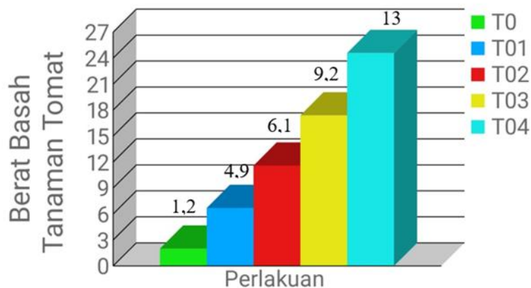
Gambar 6. Hasil pengamatan berat basah tanaman tomat (Kg)