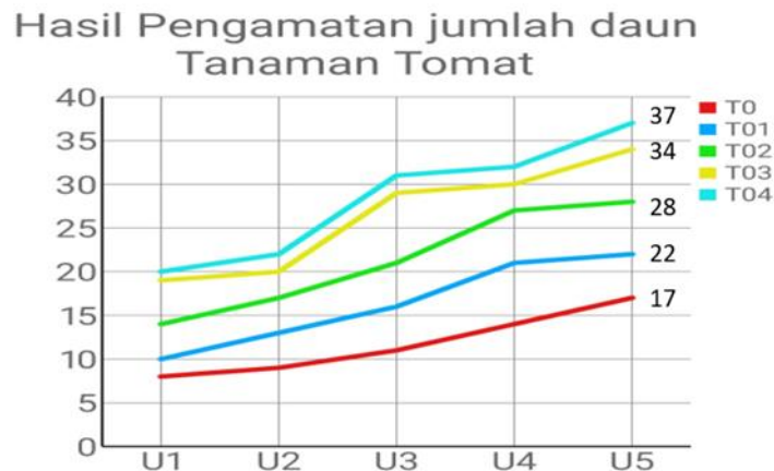
Gambar 2. Grafik jumlah daun pada tanaman tomat

apel. Adapun jumlah daun pada tanaman tomat apel dapat digambarkan pada grafik berikut ini