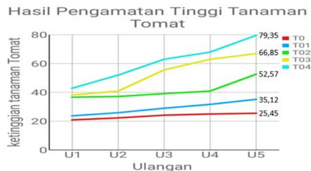
Gambar 1. Hasil Pengamatan Tinggi Tanaman Tomat

Berdasarkan tabel diatas diketahui bahwa pemberian pupuk dari campuran air beras dan air teh berpengaruh terhadap pertumbuhan tinggi tanaman tomat, hal in terlihat dari nilai rata-rata tinggi tanaman tomat T0 atau tanpa perlakuan yang lebih kecil dari nilai rata-rata tinggi tanaman tomat yang diberikan perlakuan. Yaitu T0 21,72 Cm lebih kecil dibandingkan T1 28,64 Cm, T2 41,25 Cm, T3 52,64 Cm dan T4 61,08 Cm.