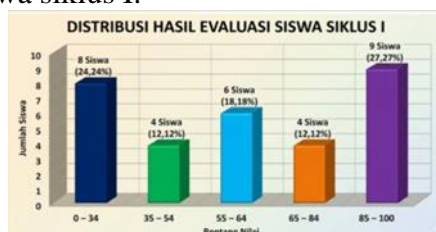
Tabel 3. Persentase Ketuntasan Belajar Siswa pada Siklus I

Berdasarkan Tabel 2, tingkat penguasaan membaca pemahaman siswa secara klasikal berada pada kategori "Sedang". Selanjutnya, analisis ketuntasan belajar siswa berdasarkan Kriteria Ketuntasan Minimal (KKM = 65) dipaparkan pada Tabel 3. Berikut gambar grafik distribusi hasil evaluasi siswa siklus I: