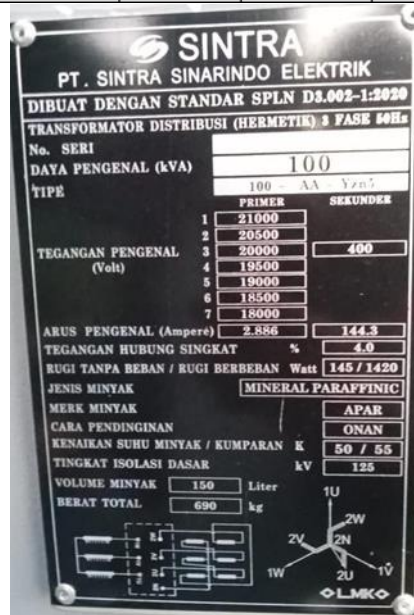
Gambar 3 Name plate transformator sesudah Uprating