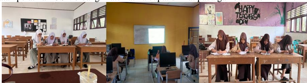
Gambar 2. Kegiatan pelatihan OSN bidang Matematika.

Berdasarkan gambar di atas, dapat dilihat bahwa persentase penguasaan indikator kemampuan pemecahan masalah adalah indikator 1 yaitu memahami masalah dan indikator dengan persentase terendah adalah indikator 4 yaitu memeriksa kembali. Menurut analisis lembar jawaban siswa ditemukan bahwa indikator memeriksa kembali merupakan indikator dengan persentase terendah. Menurut Irna, dkk (2025) hal ini diakibatkan oleh siswa kurang memperhatikan indikator ini, siswa sering sekali tidak menuliskan kesimpulan dari penyelesaian soal dalam lembar jawaban yang merupakan indikator memeriksa kembali. Secara keseluruhan, kemampuan pemecahan masalah siswa ekstrakurikuler OSN bidang matematika berada pada kategori sangat baik. Hal ini juga dipengaruhi oleh motivasi dari pelatih dan guru pembimbing siswa tersebut. Para siswa dilatih baik melalui daring maupun tatap muka. Pelatih dan pembimbing memberikan ruang yang penuh bagi para siswa kapan saja mereka ingin berdiskusi baik melalui grup whatsapp, zoom meeting, maupun di ruang kelas. Antusias para peserta dibuktikan juga dengan keberhasilan para siswa SMA Negeri 1 Sosa sebagai pemenang pada kompetisi OSN tingkat kabupaten pada 3 tahun terakhir ini. Sehingga para siswa tersebut telah mewakili kabupaten pada tingkat Propinsi. Adapun kegiatan pelatihan OSN bidang Matematika dapat dilihat pada gambar 2 berikut ini: