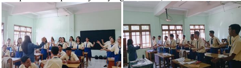
Tabel penilaian pertemuan 2

Hasil penelitian ini menunjukkan bahwa latihan melalui imitasi dan drill mampu mengembangkan keterampilan psikomotorik siswa dalam bidang seni musik secara efektif, sejalan dengan tujuan penelitian yaitu meningkatkan kemampuan direksi pola birama \frac{3}{4} melalui penerapan metode pembelajaran yang terstruktur, aktif, dan berkesinambungan.