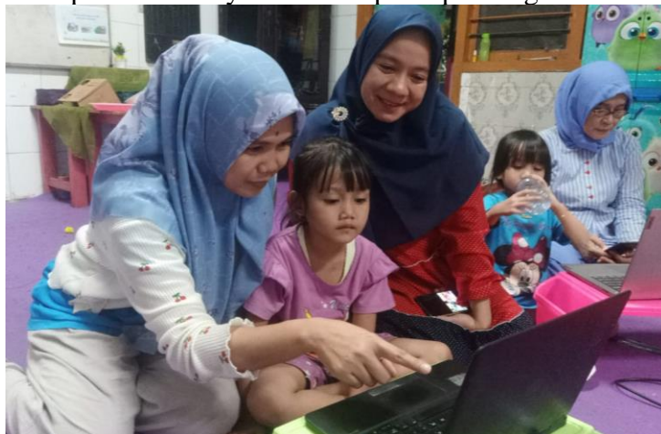
Gambar 4. Suasana pembelajaran jarak jauh (CL.2)

Praktek pembelajaran Virtual kami lakukan dengan menggunakan laptop dan semua pihak baik guru, anak dan orang tua sudah mengikuti petunjuk yang telah disiapkan oleh guru baik dari waktu dan teknis pelaksanaannya. Suasana persiapan tergambar dalam CL.1