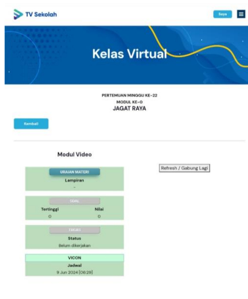
Gambar 2 Tampilan TV Sekolah Kelas virtual (CD.2)