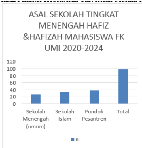
Tabel 3. Diagram Berdasarkan Asal Sekolah Tingkat Menengah Hafiz dan Hafizah Fakultas Kedokteran Universitas Muslim Indonesia

Berdasarkan hasil penelitian data asal daerah provinsi sebagai proporsi terendah sebanyak 1 orang (1%) pada masing-masing provinsi yaitu Jawa Tengah 1 orang (1%), Kalimantan Selatan 1 orang (1%), Kalimantan utara 1 orang (1%), Maluku 1 orang (1%), NTT 1 orang (1%), Papua Barat 1 orang (1%), sedangkan dari hasil data dengan proporsi tertinggi dari Sulawesi selatan sebanyak 73 orang (73.6%). Penelitian ini sejalan dengan sebuah penelitian yang dilakukan oleh Penelitian sejalan dengan