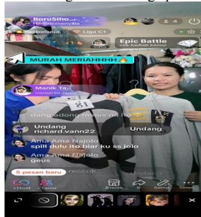
Gambar 2. Memasarkan produk dengan cara live tiktok