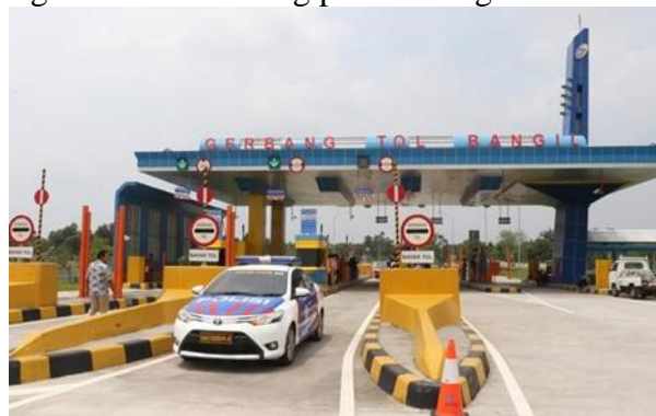
Gambar 11 Jalan Tol Jawa Timur

JGU juga terlibat dalam proyek infrastruktur seperti Jalan Tol Jawa Timur dan Reklamasi Teluk Lamong untuk mendukung perkembangan daerah.