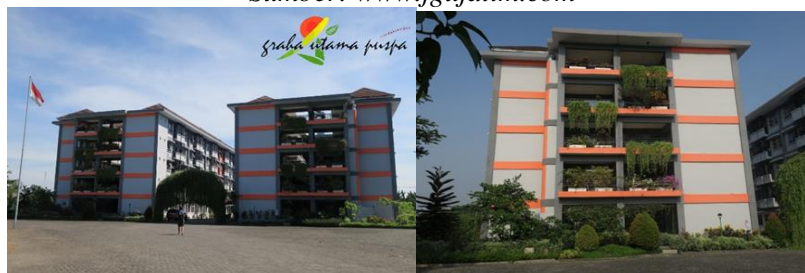
Gambar 8 Rusunawa Graha Utama Puspa, Sidoarjo, Jawa Timur