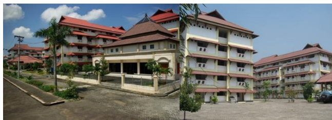
Gambar 7 Graha Utama Ahmad Yani, Surabaya, Jawa Timur

Selanjutnya dalam bidang usaha properti sewa, JGU menyediakan hunian sewa yang ekonomis, aman, dan nyaman yaitu Rusunawa Graha Utama Ahmad Yani, dan Rusunawa Graha Utama Puspa.