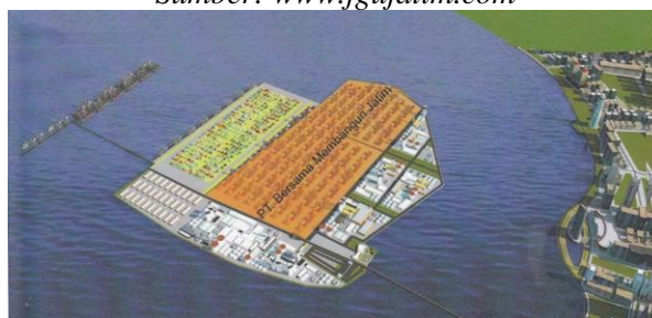
Gambar 12 Reklamasi Teluk Lamong