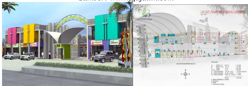
Gambar 10 Pasar Induk Beras Lamongan, Lamongan, Jawa Timur

JGU juga terlibat dalam proyek infrastruktur seperti Jalan Tol Jawa Timur dan Reklamasi Teluk Lamong untuk mendukung perkembangan daerah.