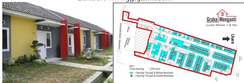
Gambar 3 Graha Menganti 2, Gresik, Jawa Timur