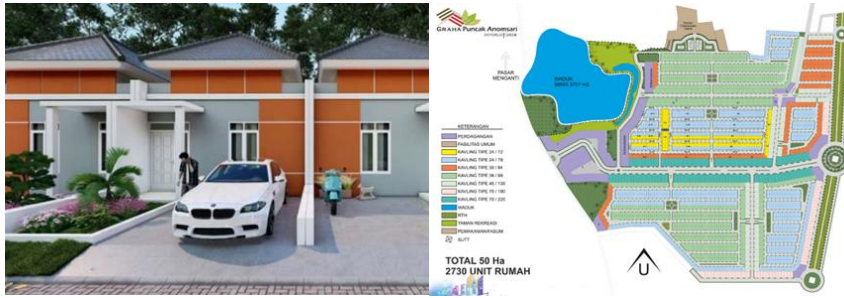
Gambar 4 Graha Puncak Anom Sari, Gresik, Jawa Timur