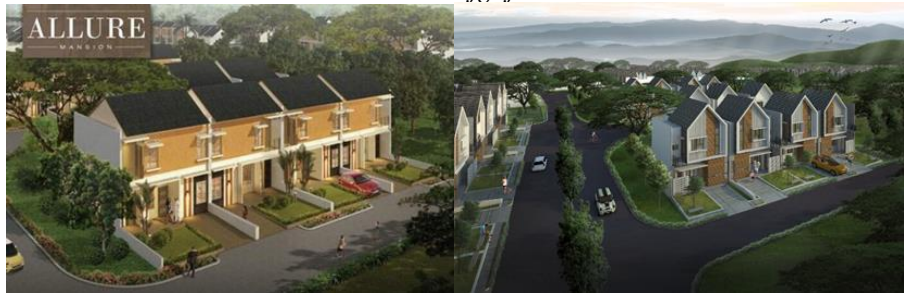
Gambar 5 Allure Mansion, Bekasi, Jawa Barat