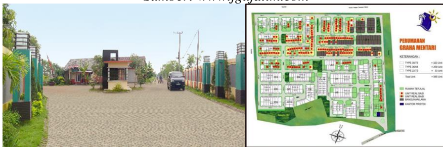
Gambar 6 Graha Mentari, Bangkalan, Jawa Timur